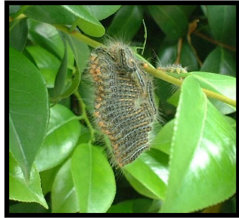
両方とも、てかてかとした光沢がある