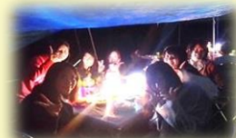
今日は特別アウトドア女子会♪