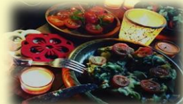
SNSにあげたくなるオシャレご飯！