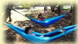
森の中でゆらゆらハンモック♡

【日時】平成29年10月28日（土）～29日（日） 【参加費】10,800円 【対象】20～40代の女性 【定員】12名 ※要予約 【会場】大房岬自然公園第2キャンプ場