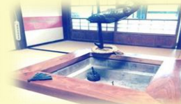
囲炉裏を囲んでのんびり♪