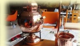
オリジナルアロマウォーター作り♪