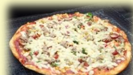
特製石窯でピザづくり♡