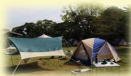
一緒にテントをたてましょう！