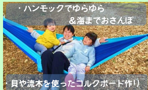
・ハンモックでゆらゆら & 海までおさんぽ