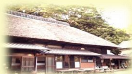
築180年の茅葺き古民家

【日時】平成29年11月18日（土）～19日（日） 【参加費】12,800円 【対象】20～40代の女性 【定員】12名 ※要予約 【会場】茅葺古民家ろくすけ（千葉県南房総市）